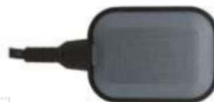
PLOVÁKOVÝ SPÍNAČ OLA INOX