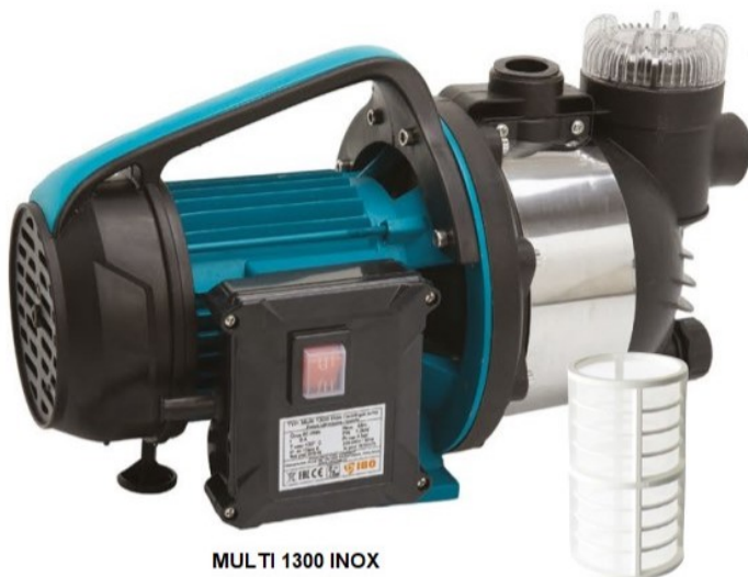
MULTI 1300 INOX